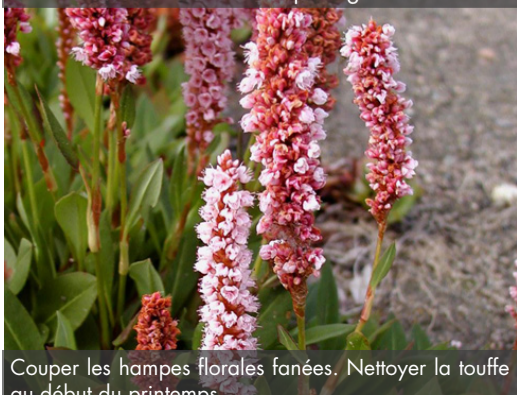
13. PERSICARIA affinis 'Darjeeling Red' - Renoué

Couper les hampes florales fanées. Nettoyer la touffe au début du printemps.