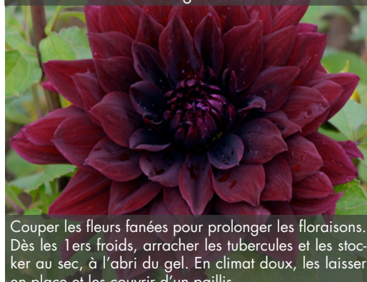
15. DAHLIA 'André Dognin'

Couper les fleurs fanées pour prolonger les floraisons. Dès les 1ers froids, arracher les tubercules et les stocker au sec, à l'abri du gel. En climat doux, les laisser en place et les couvrir d'un paillis.