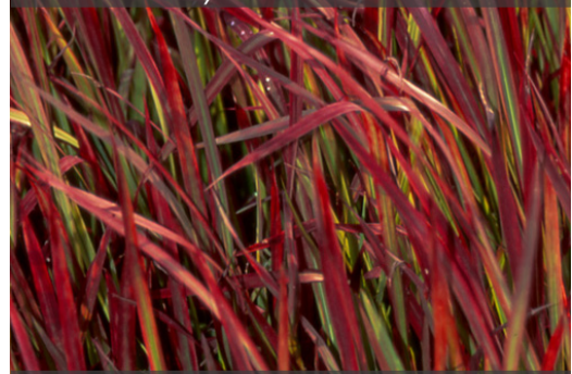
11. IMPERATA cylindrica 'Red Baron'

Couper les fleurs sèches à ras en fin d'hiver. Protéger d'un paillis sec en régions très froides l'hiver.