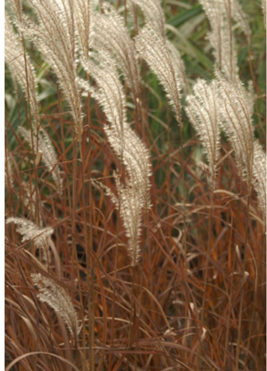
2. MISCANTHUS sinensis 'Adagio' - Eulalie

Supprimer les tiges abîmées en fin d'automne. Les chaumes restants donneront le relief au massif en hiver. Rabattre la touffe au plus tard en fin d'hiver.