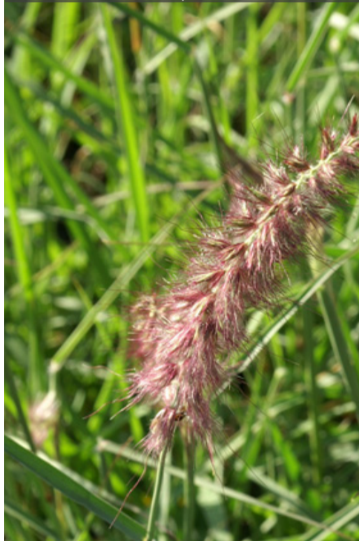
5. PENNISETUM 'Karley Rose'®

Rabattre la touffe au plus tard en fin d'hiver. Protéger d'un paillis en climat froid l'hiver.