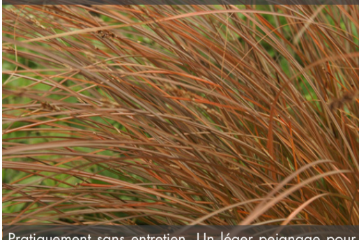
9. CAREX tenuiculmis - Laïche

Pratiquement sans entretien. Un léger peignage pour enlever les parties sèches suffit généralement en fin d'hiver.