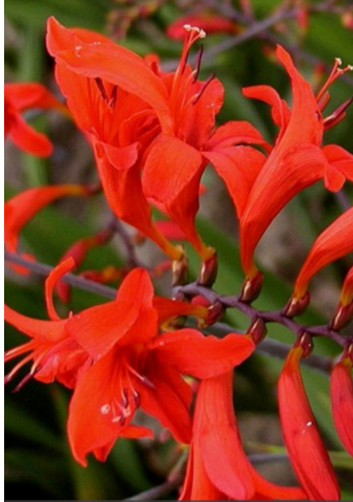
1. CROCOSMIA 'Lucifer' - Monbretia

Supprimer les fleurs fanées pour prolonger les floraisons. Rabattre la touffe sèche dès qu'elle n'est plus décorative et pailler en régions froides. Diviser les touffes trop prolifiques.