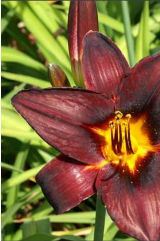
4. HEMEROCALLIS 'Chocolate Candy'

Supprimer les tiges florales fanées. Nettoyer la touffe dès qu'elle n'est plus décorative et en fin d'hiver. Pailler pour garder le sol frais.