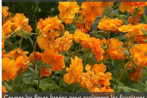
10. GEUM 'Fire Storm'® - Benoîte

Couper les fleurs fanées pour prolonger les floraisons. Nettoyer la touffe au début du printemps. Diviser la souche tous les 3-4 ans.