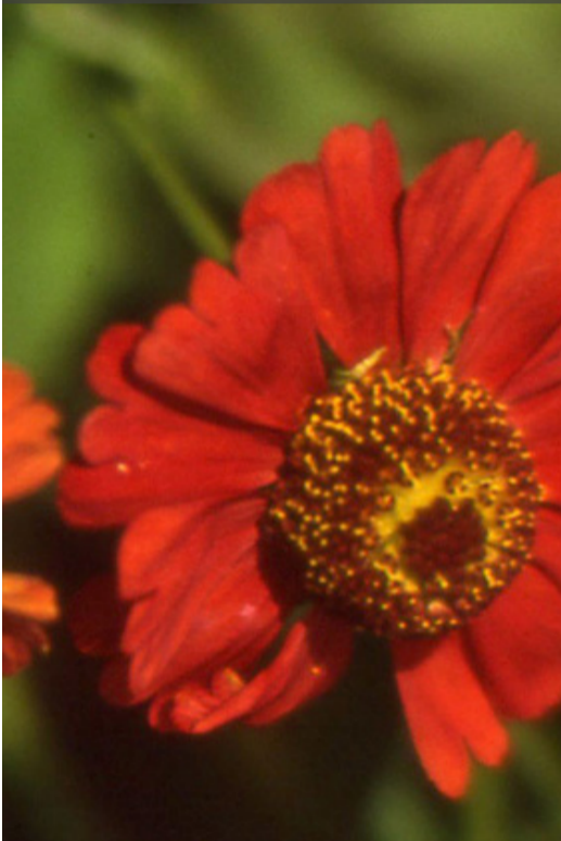
3. HELENIUM 'Indianersommer' - Hélénie

Couper les fleurs fanées au niveau du bouton suivant pour prolonger les floraisons. Rabattre la touffe sèche en fin d'automne. Diviser tous les 3-4 ans.