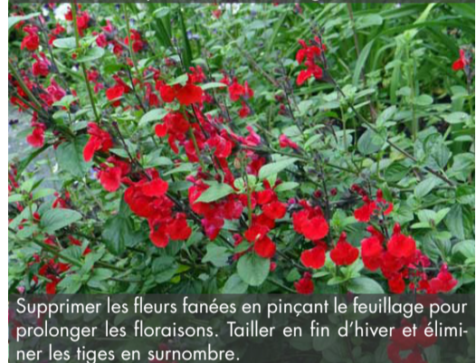
6. SAVIA 'Royal Bumble' - Sauge

Supprimer les fleurs fanées en pinçant le feuillage pour prolonger les floraisons. Tailler en fin d'hiver et éliminer les tiges en surnombre.