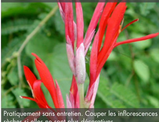
14. CANNA 'Ibis'

Pratiquement sans entretien. Couper les inflorescences sèches si elles ne sont plus décoratives.