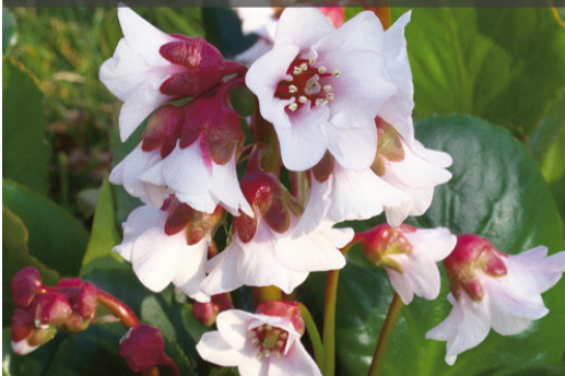
8. BERGENIA 'Hartzkristall' - Plante des savetiers

Couper les inflorescences fanées. Enlever les feuilles sèches ou brunes.