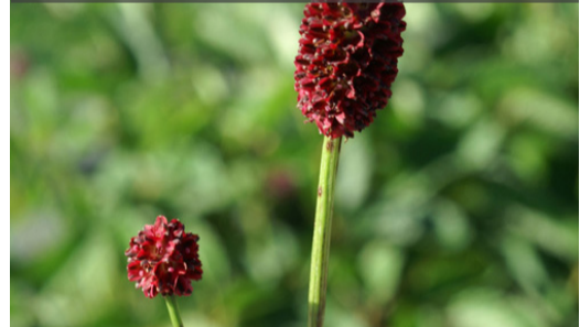
7. SANGUISORBA officinalis 'Tanna'

Supprimer les fleurs fanées pour prolonger les floraisons. Rabattre la touffe sèche en fin d'hiver.