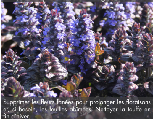
7. AJUGA reptans 'Elmblüt' - Bugle

Supprimer les fleurs fanées pour prolonger les floraisons et, si besoin, les feuilles abimées. Nettoyer la touffe en fin d'hiver.