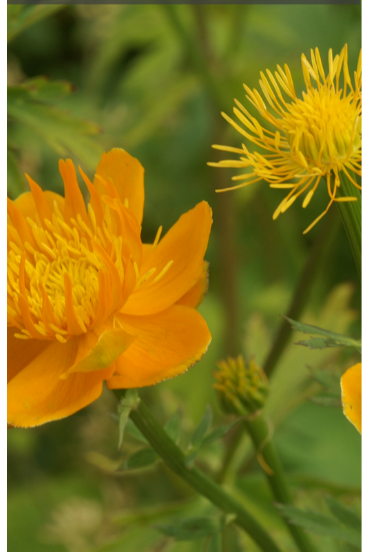
6. TROLLIUS chinensis 'Golden Queen' - Trolle

Couper les fleurs fanées pour prolonger les floraisons. Rabattre la touffe sèche et la nettoyer dès qu'elle n'est plus décorative, au plus tard en fin d'hiver.