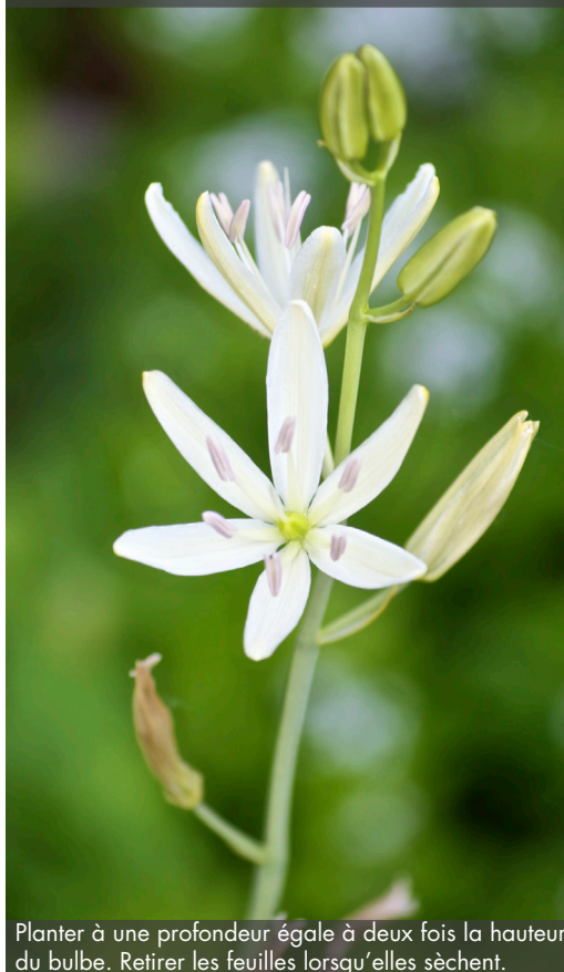
10. CAMASSIA leichtlinii 'Alba' - Quamash

Planter à une profondeur égale à deux fois la hauteur du bulbe. Retirer les feuilles lorsqu'elles sèchent.