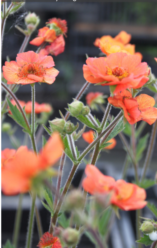
5. GEUM 'Totally Tangerine'® - Benoîte

Couper les fleurs fanées pour prolonger les floraisons. Nettoyer la touffe avant le démarrage de la végétation au printemps. Diviser la souche tous les 3 ou 4 ans.