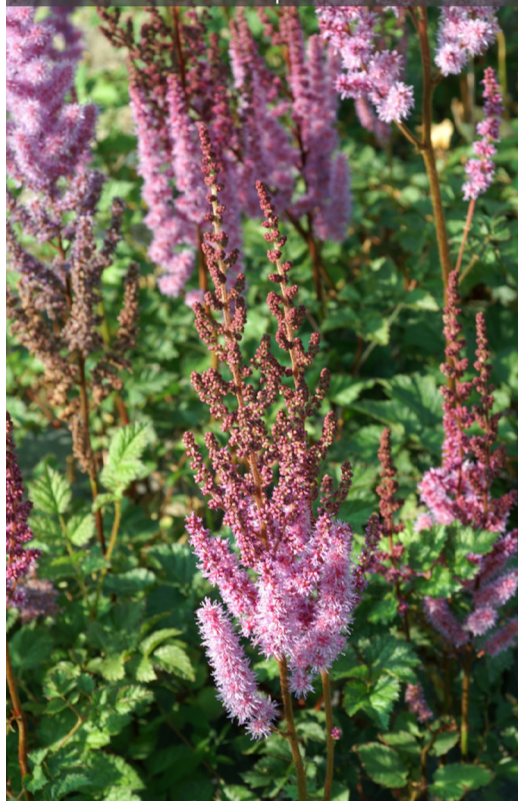
4. ASTILBE chinensis 'Purpurlanze' - Astilbe

Le graphisme de la plante, même avec le feuillage sec et les hampes florales défléuries, reste intéressant. Rabattre dès que la touffe n'est plus décorative.