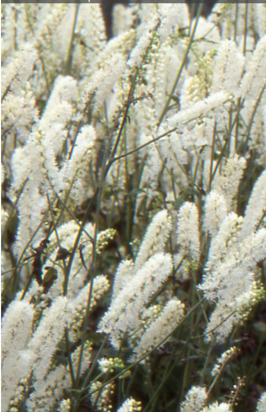
3. ACTAEA simplex 'White Pearl' - Actaea

Supprimer les fleurs fanées pour prolonger les floraisons. Rabattre en fin de saison, dès que la touffe sèche n'est plus décorative. Un apport de matière organique est conseillé.