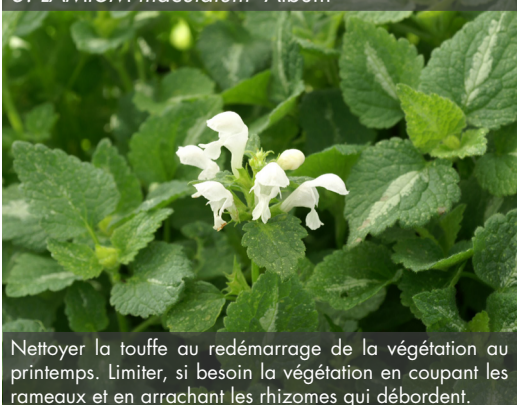
8. LAMIUM maculatum 'Album'

Nettoyer la touffe au redémarrage de la végétation au printemps. Limiter, si besoin la végétation en coupant les rameaux et en arrachant les rhizomes qui débordent.