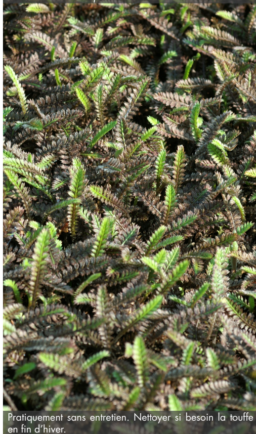
9. LEPTINELLA squalida 'Platt's Black'

Pratiquement sans entretien. Nettoyer si besoin la touffe en fin d'hiver.