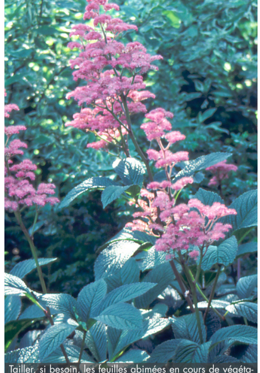
2. RODGERSIA henrici - Rodgersia

Tailler, si besoin, les feuilles abimées en cours de végétation. Les inflorescences donnant des fruits souvent beaux l'hiver, rabattre la touffe sèche dès qu'ils ne sont plus décoratifs, en fin d'hiver.