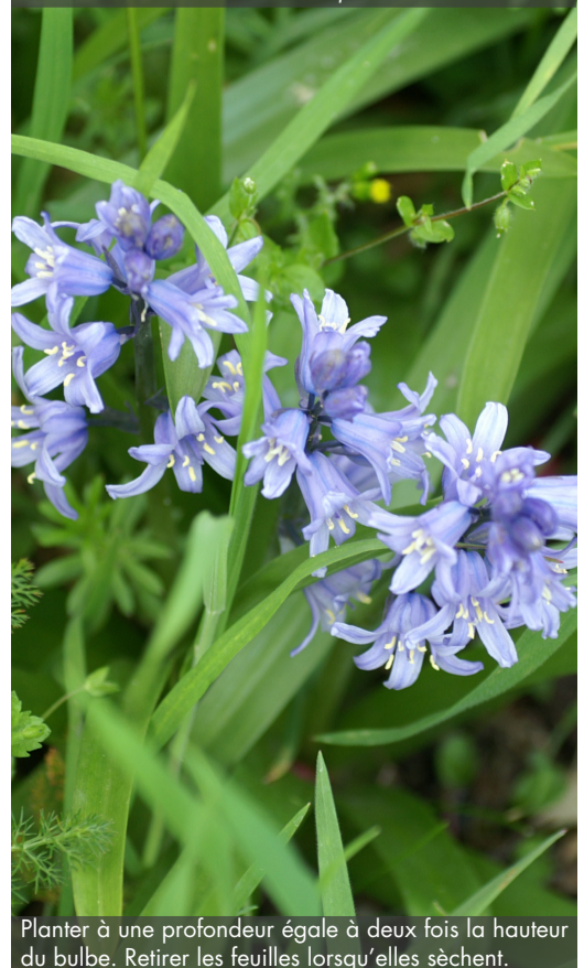
11. HYACINTHOIDES non-scripta - Jacinthe des bois

Planter à une profondeur égale à deux fois la hauteur du bulbe. Retirer les feuilles lorsqu'elles sèchent.