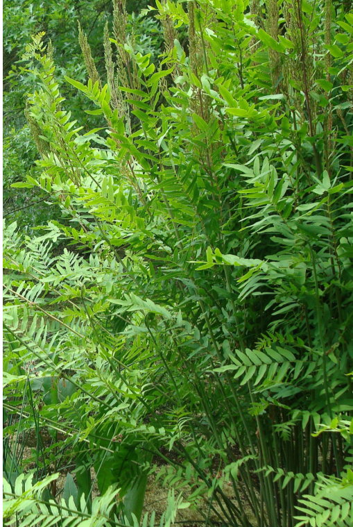
1. OSMUNDA regalis - Osmonde royale

Couper les feuilles abimées qu'elles soient fraîches ou sèches l'hiver. Rabattre au plus tard au redémarrage de la végétation et nettoyer la touffe.