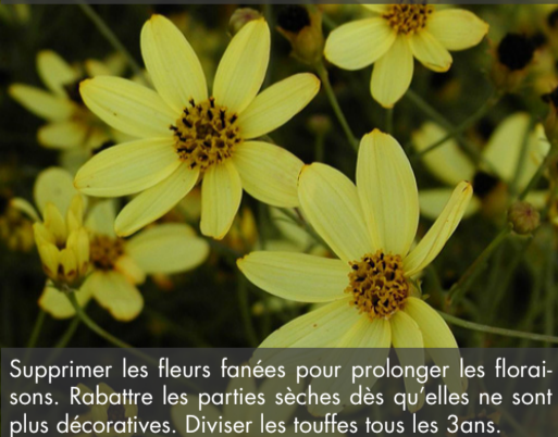
10. COREOPSIS verticillata 'Moonbeam'

Supprimer les fleurs fanées pour prolonger les floraisons. Rabattre les parties sèches dès qu'elles ne sont plus décoratives. Diviser les touffes tous les 3 ans.