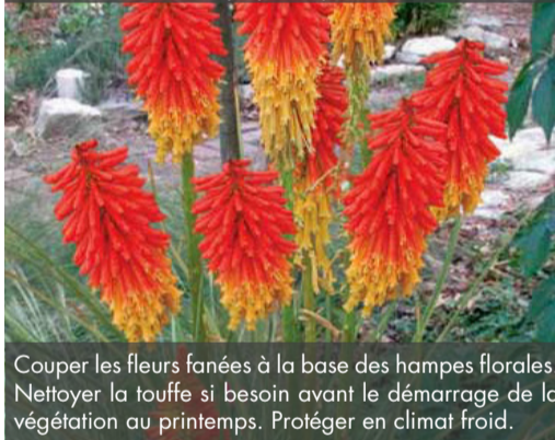
8. KNIPHOFIA 'Papaya Popsicle'®

Couper les fleurs fanées à la base des hampes florales. Nettoyer la touffe si besoin avant le démarrage de la végétation au printemps. Protéger en climat froid.