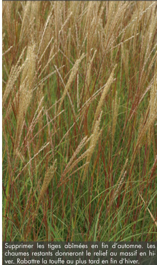
9. MISCANTHUS sinensis 'Yaku Jima Dwarf'

Supprimer les tiges abîmées en fin d'automne. Les chaumes restants donneront le relief au massif en hiver. Rabattre la touffe au plus tard en fin d'hiver.