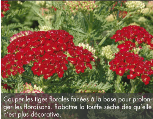
4. ACHILLEA 'Pomegranate' - Achillée

Couper les tiges florales fanées à la base pour prolonger les floraisons. Rabattre la touffe sèche dès qu'elle n'est plus décorative.