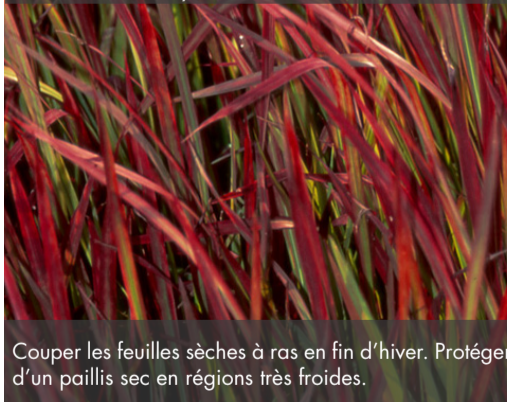
11. IMPERATA cylindrica 'Red Baron'

Couper les feuilles sèches à ras en fin d'hiver. Protéger d'un paillis sec en régions très froides.