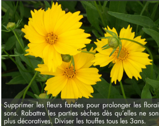
5. COREOPSIS grandiflora 'Mayfield Giant'

Supprimer les fleurs fanées pour prolonger les floraisons. Rabattre les parties sèches dès qu'elles ne sont plus décoratives. Diviser les touffes tous les 3 ans.