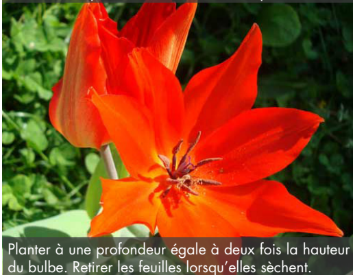
15. TULIPA praestans 'Fusilier' - Tulipe

Planter à une profondeur égale à deux fois la hauteur du bulbe. Retirer les feuilles lorsqu'elles sèchent.