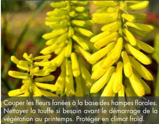
7. KNIPHOFIA 'Lemon Popsicle'®

Couper les fleurs fanées à la base des hampes florales. Nettoyer la touffe si besoin avant le démarrage de la végétation au printemps. Protéger en climat froid.