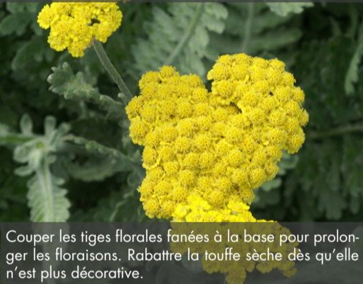
3. ACHILLEA 'Moonshine' - Achillée

Couper les tiges florales fanées à la base pour prolonger les floraisons. Rabattre la touffe sèche dès qu'elle n'est plus décorative.