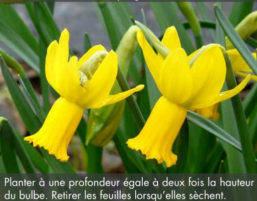
14. NARCISSUS 'Peeping Tom' - Narcisse

Planter à une profondeur égale à deux fois la hauteur du bulbe. Retirer les feuilles lorsqu'elles sèchent.