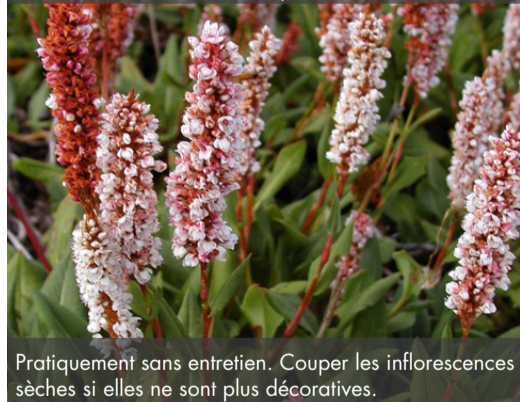
13. PERSICARIA affinis 'Superba' - Renouée

Pratiquement sans entretien. Couper les inflorescences sèches si elles ne sont plus décoratives.