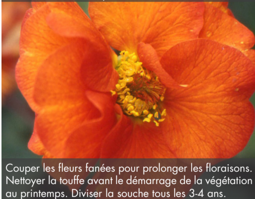
10. GEUM 'Fire Opal' - Benoîte

Couper les fleurs fanées pour prolonger les floraisons. Nettoyer la touffe avant le démarrage de la végétation au printemps. Diviser la souche tous les 3-4 ans.