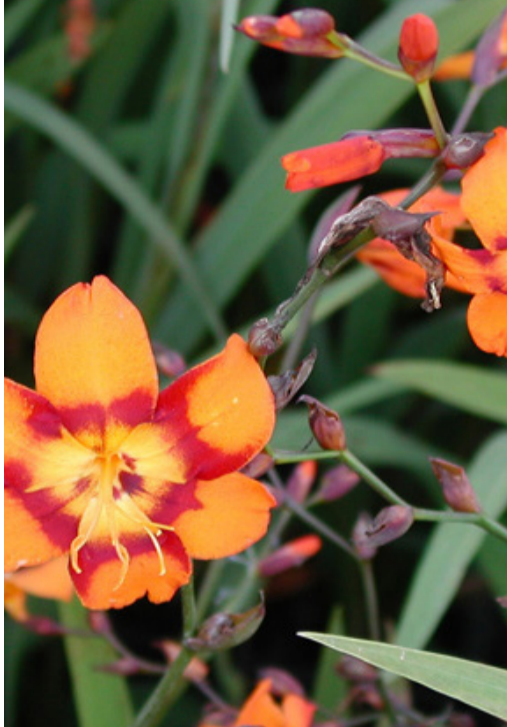
1. CROCOSMIA 'Emily McKenzie' - Monbretia

Supprimer les fleurs fanées pour prolonger les floraisons. Rabattre les parties sèches dès qu'elles ne sont plus décoratives et pailler en régions froides. Diviser les touffes trop prolifiques.