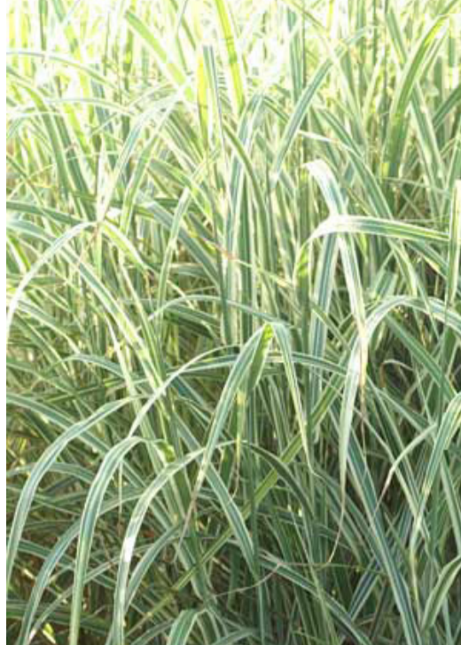
2. MISCANTHUS sinensis 'Dixieland' - Eulalie

Supprimer les tiges abîmées en fin d'automne. Les chaumes restants donneront le relief au massif en hiver. Rabattre la touffe au plus tard en fin d'hiver.