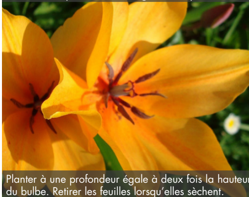
16. TULIPA praestans 'Shogun' - Tulipe

Planter à une profondeur égale à deux fois la hauteur du bulbe. Retirer les feuilles lorsqu'elles sèchent.