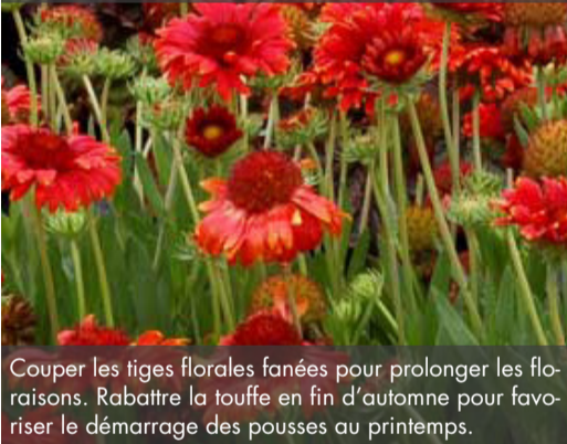
6. GAILLARDIA 'Red Sun' - Gaillarde

Couper les tiges florales fanées pour prolonger les floraisons. Rabattre la touffe en fin d'automne pour favoriser le démarrage des pousses au printemps.