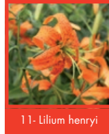
11- Lilium henryi

Si vous envisagez de créer votre massif près d'un mur ou d'une haie, nous vous recommandons de changer la disposition de certaines plantes. Il est conseillé de créer un effet "escalier" pour un rendu final plus harmonieux.