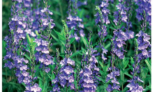
13. VERONICA austriaca 'Royal Blue' - Véronique

Couper les fleurs fanées. Nettoyer la touffe au plus tard en fin d'hiver.