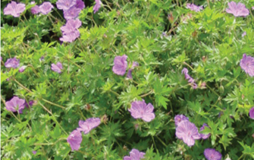
12. GERANIUM 'Blushing Turtle®' - Bec de grue

Raccourcir les tiges après chaque floraison pour favoriser une nouvelle végétation. Tailler en petites touffes en fin d'hiver.