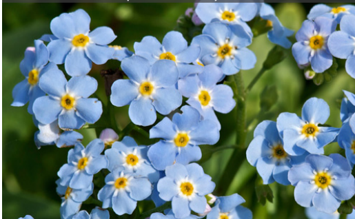
15. MYOSOTIS palustris - Myosotis des marais

Tailler les fleurs fanées et les tiges sèches pour prolonger les floraisons. Tailler dès que la touffe n'est plus décorative. Elle se ressème abondamment.