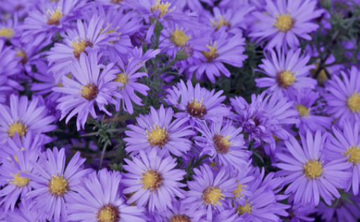
10. ASTER 'Lady in Blue' - Aster

Supprimer les fleurs fanées et rabattre la touffe en fin d'automne. Diviser tous les 3-4 ans pour maintenir une bonne végétation et floribondité.