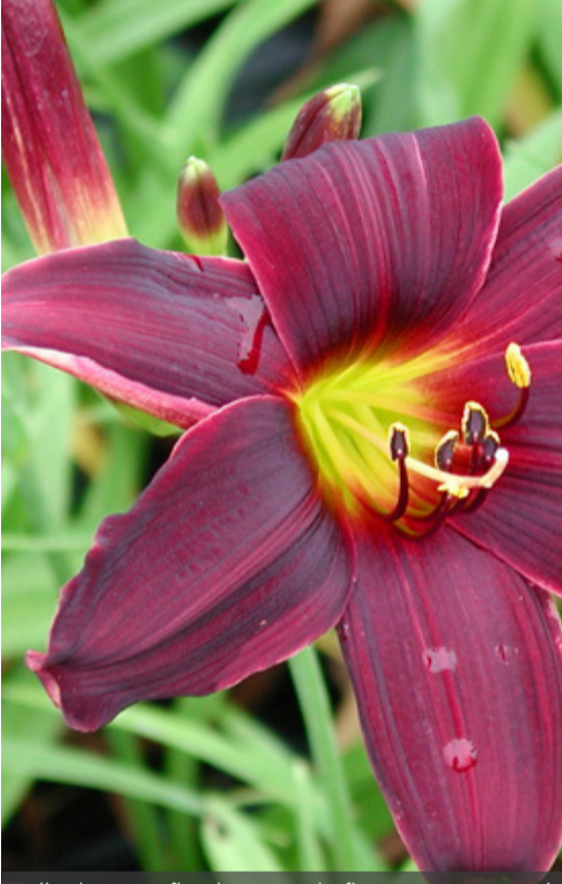
7. HEMEROCALLIS 'American Revolution'

Tailler les tiges florales après la floraison. Nettoyer la touffe dès qu'elle n'est plus décorative et en fin d'hiver. Pailler pour garder le sol frais.