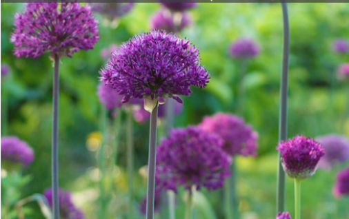
16. ALLIUM aflatunense 'Purpurea Sensation'

Planter les bulbes à une profondeur égale à eux fois la hauteur du bulbe. Supprimer les inflorescences dès qu'elles ne sont plus décoratives.