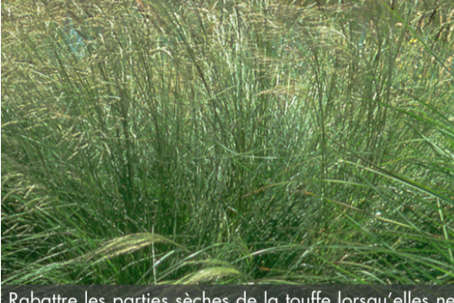
3. ERAGROSTIS curvula ' - Eragrostide

Rabattre les parties sèches de la touffe lorsqu'elles ne sont plus décoratives, au plus tard en fin d'hiver.