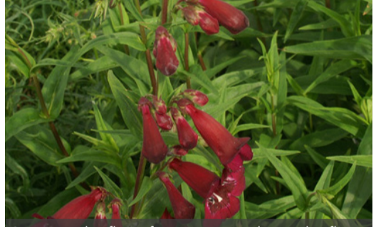
9. PENSTEMON 'Blackbird' - Galane

Supprimer les fleurs fanées pour prolonger les floraisons. Tailler à 10cm en fin d'hiver et éclaircir les tiges si besoin. Protéger d'un paillis en climat froid l'hiver.