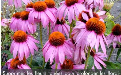
11. ECHINACEA purpurea 'Kim's Knee High®'

Supprimer les fleurs fanées pour prolonger les floraisons mais conserver celles de fin de saison qui, sèches, donneront du graphisme au massif l'hiver. Nettoyer la touffe au plus tard au début du printemps.