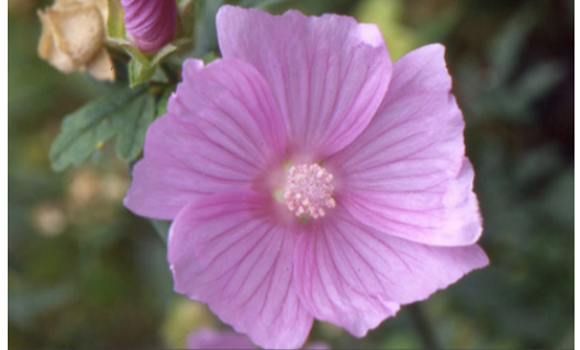
8. MALVA alcea 'Fastigiata' - Mauve

Supprimer les fleurs fanées en époutant les tiges. Rabattre la touffe à 2 ou 3 yeux avant le démarrage de la végétation au printemps.