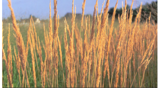
2. CALAMAGROSTIS acutiflora 'Karl Foester'

Supprimer les tiges abîmées en fin d'automne. Les chaumes restants donneront le relief au massif en hiver. Rabattre la touffe au plus tard en fin d'hiver.