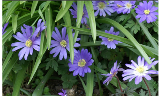
17. ANEMONE blanda 'Blue Shades'

Planter les bulbes à une profondeur égale à eux fois la hauteur du bulbe. Retirer les feuilles lorsqu'elles jaunissent et sèchent.