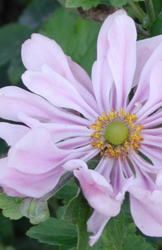
5. ANEMONE hybrida 'Königin Charlotte'

Supprimer les tiges florales fanées pour prolonger les floraisons. Nettoyer la touffe en fin d'hiver.