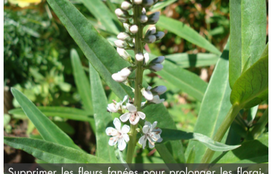
4. LYSIMACHIA ephemerum - Lysimaque

Supprimer les fleurs fanées pour prolonger les floraisons. Rabattre le feuillage lorsqu'il n'est plus décoratif.