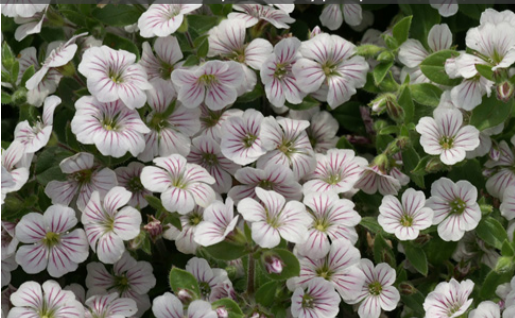
14. GYPSOPHILA repens - Gypsophile

Raccourcir la touffe après floraison pour favoriser une nouvelle végétation. Couper les parties sèches avant le démarrage de la végétation au printemps.