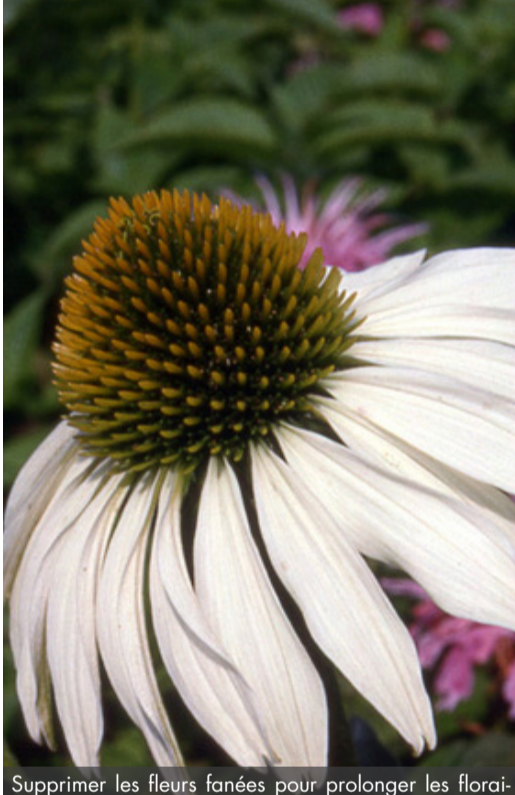
6. ECHINACEA purpurea 'Alba'

Supprimer les fleurs fanées pour prolonger les floraisons mais conserver celles de fin de saison qui, sèches, donneront du graphisme au massif l'hiver. Nettoyer la touffe au plus tard au début du printemps.