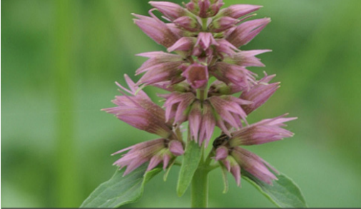
1. AGASTACHE 'Ayala' - Agastache

Supprimer les fleurs fanées pour prolonger les floraisons. Rabattre la touffe sèche dès qu'elle n'est plus décorative. Protéger en régions froides l'hiver.