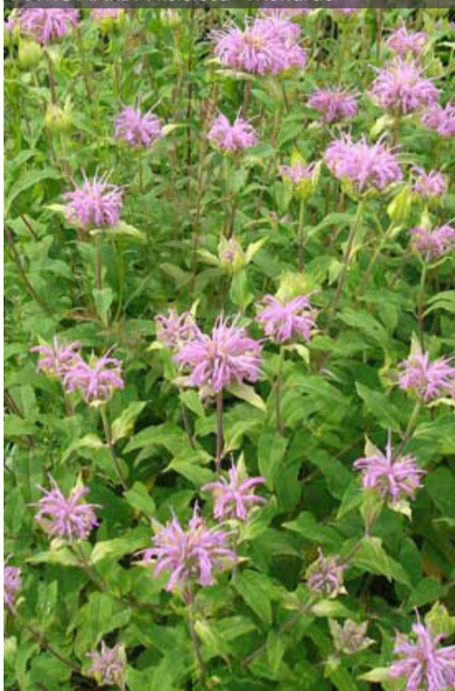
7. MONARDA fistulosa - Monarde

Couper les fleurs fanées pour prolonger les floraisons. Rabattre la touffe sèche dès qu'elle n'est plus décorative, au plus tard en fin d'hiver.