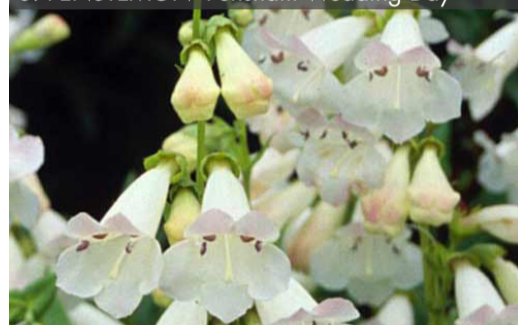
8. PENSTEMON 'Pensham Wedding Day'

Couper les fleurs fanées pour prolonger les floraisons. Tailler à 10 cm en fin d'hiver et éclaircir les tiges, si besoin. Protéger en climat très froid.