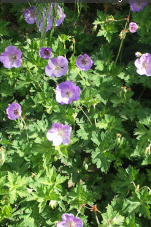
6. GERANIUM 'Azure Rush' - Bec de grue

Couper les inflorescences fanées et raccourcir les tiges si besoin. Rabattre la touffe dès qu'elle n'est plus décorative, au plus tard en fin d'hiver.