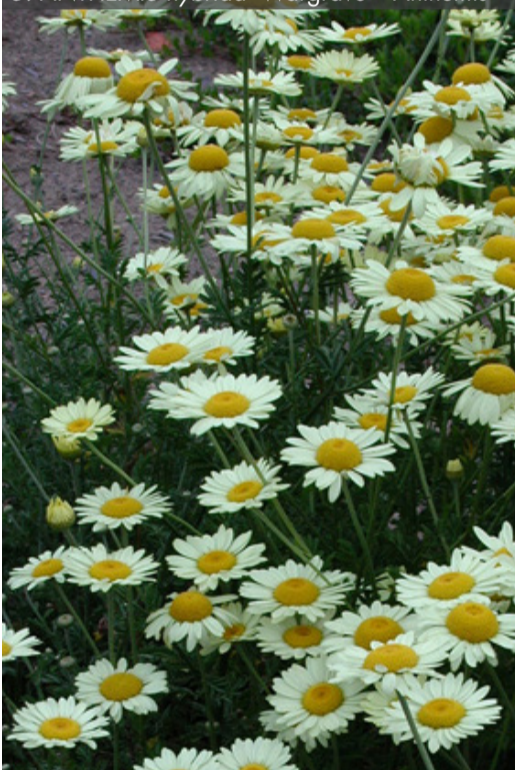
5. ANTHEMIS hybrida 'Wargrave' - Anthémis

Supprimer les fleurs fanées pour prolonger les floraisons. Couper court, en fin de saison, pour faciliter le bourgeonnement avant l'hiver et éviter que la plante s'élimine.