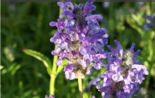
11. NEPETA nervosa - Menthe des chats

Après floraison, rabattre la touffe qui donnera rapidement une nouvelle végétation et floraison. Couper le feuillage sec en fin d'automne.