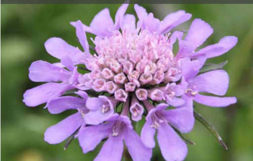
12. SCABIOSA colombaria - Scabieuse

Couper les fleurs fanées pour prolonger les floraisons. Tailler les parties sèches et nettoyer la touffe au plus tard en fin d'hiver.