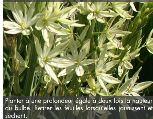
14. CAMASSIA leichtlinii 'Alba'

Planter à une profondeur égale à deux fois la hauteur du bulbe. Retirer les feuilles lorsqu'elles jaunissent et sèchent.