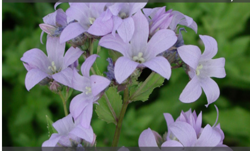
3. CAMPANULA lactiflora 'Prichard's Variety'

Supprimer les fleurs fanées en époinçant le feuillage pour prolonger les floraisons. Rabattre la touffe sèche dès qu'elle n'est plus décorative.