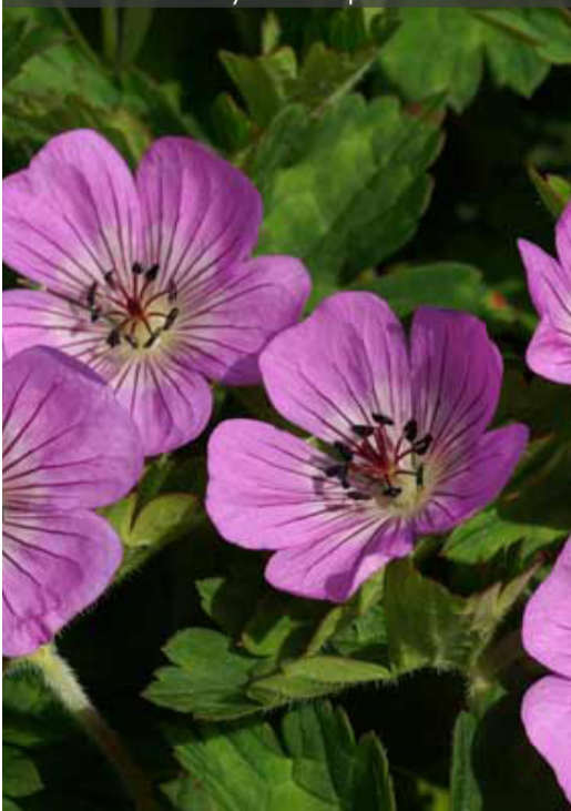
10. GERANIUM 'Sylvia's Surprise'®

Couper les inflorescences fanées et raccourcir les tiges si besoin. Rabattre la touffe dès qu'elle n'est plus décorative et au plus tard en fin d'hiver.