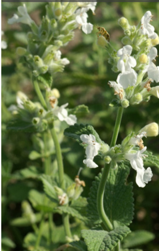
13. NEPETA racemosa 'Snowflake'

Après floraison, rabattre la touffe qui donnera rapidement une nouvelle végétation et floraison. Couper le feuillage sec en fin d'automne.