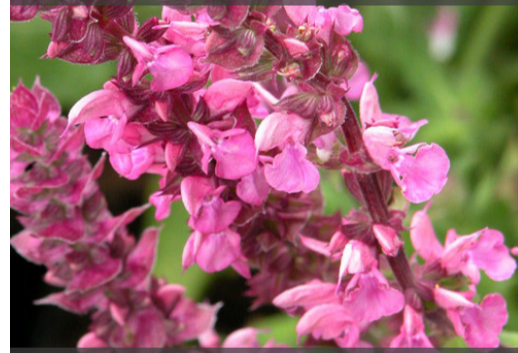
9. SALVIA nemorosa 'Rose Queen'

Couper les fleurs fanées pour prolonger les floraisons. Rabattre la touffe sèche au plus tard en fin d'hiver.