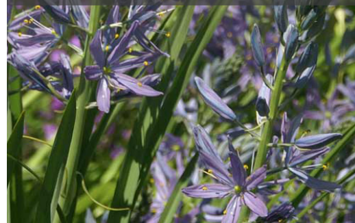
15. CAMASSIA leichtlinii 'Alba'

Planter à une profondeur égale à deux fois la hauteur du bulbe. Retirer les feuilles lorsqu'elles jaunissent et sèchent.