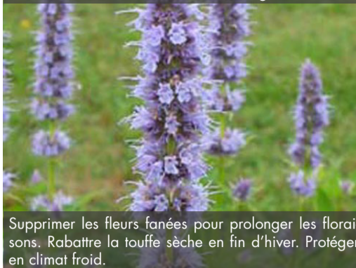
1. AGASTACHE 'Blue Fortune' - Agastache

Supprimer les fleurs fanées pour prolonger les floraisons. Rabattre la touffe sèche en fin d'hiver. Protéger en climat froid.