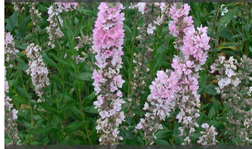
4. LYTHRUM salicaria 'Blush'

Couper les inflorescences fanées pour prolonger les floraisons. Rabattre la touffe lorsqu'elle n'est plus décorative, au plus tard en fin d'hiver.